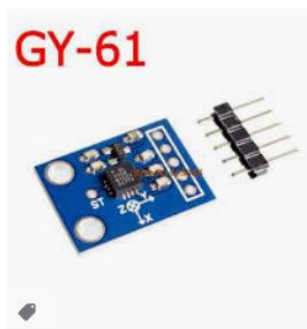
ADXL335 three axis accelero...