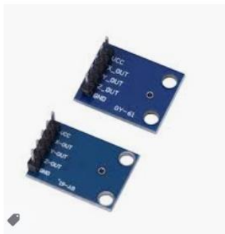
GY 61 ADXL335 Acceleromete...