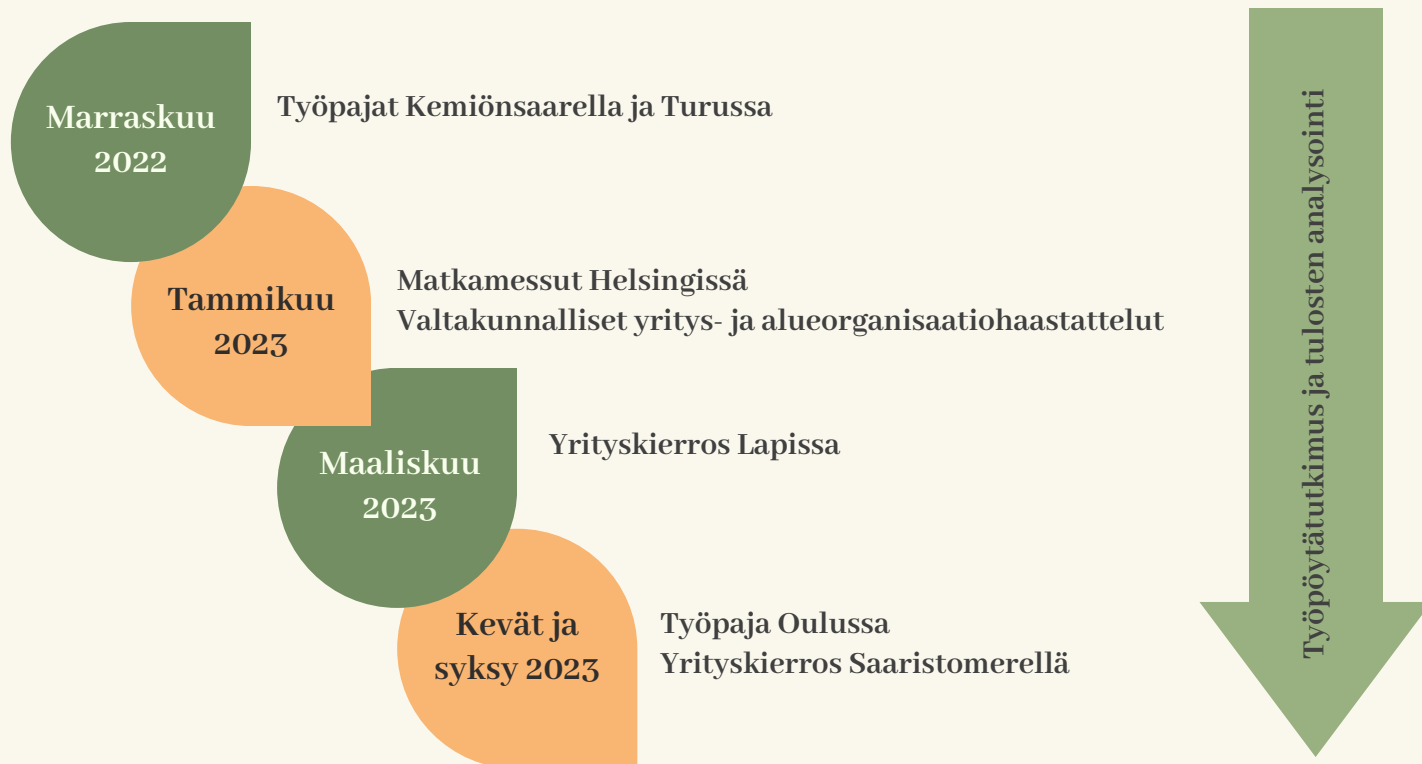
Kuva 1. Tiedonkeruun eri vaiheet

Käyttäjälähtöisen tiedonkeruun ja työpöytätyöskyt tulokset on koottu tähän raporttiin. Osiossa kaksi käydään läpi työpöytätyöskyt tuloksia ja osiossa kolme perehdytään käyttäjälähtöisen tiedonkeruun tuloksiin. Osiossa neljä kootaan tiedonkeruun aikana saatuja tuloksia konkreettisiksi sisältöaiheiksi osaamismerkkejä ja koulutuksia ajatellen. Osiossa viisi puolestaan analysoidaan tiedonkeruumallin toimivuutta ja viimeisessä osiossa kerrotaan jatkotoimenpiteistä.